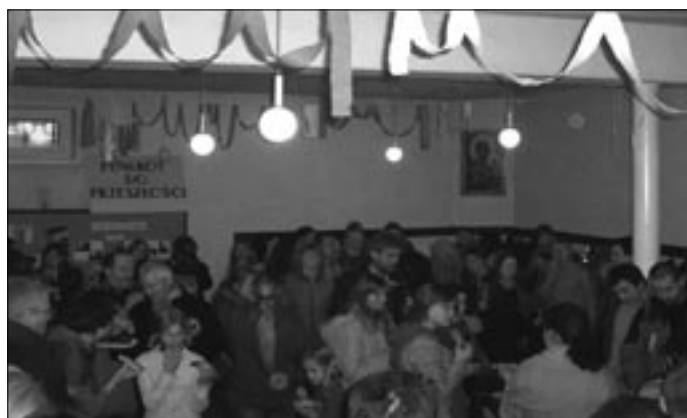
Wspólne spotkanie po Mszy św. w salkach parafialnych