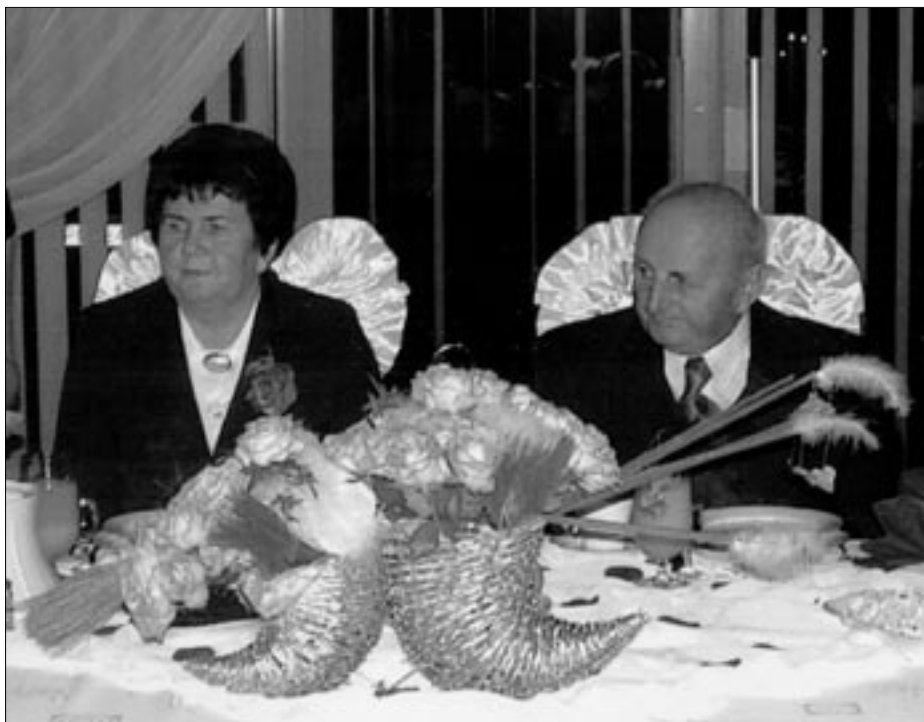
Jubilaci podczas rodzinnego przyjęcia