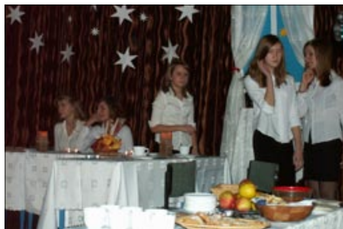
W tym roku szkolnym wiązanek wierszy bożonarodzeniowych, kolęd i pieśni zaprezentowali uczniowie klas drugich gimnazjum

nauczyciel religii w Zespole Szkół Chemicznych