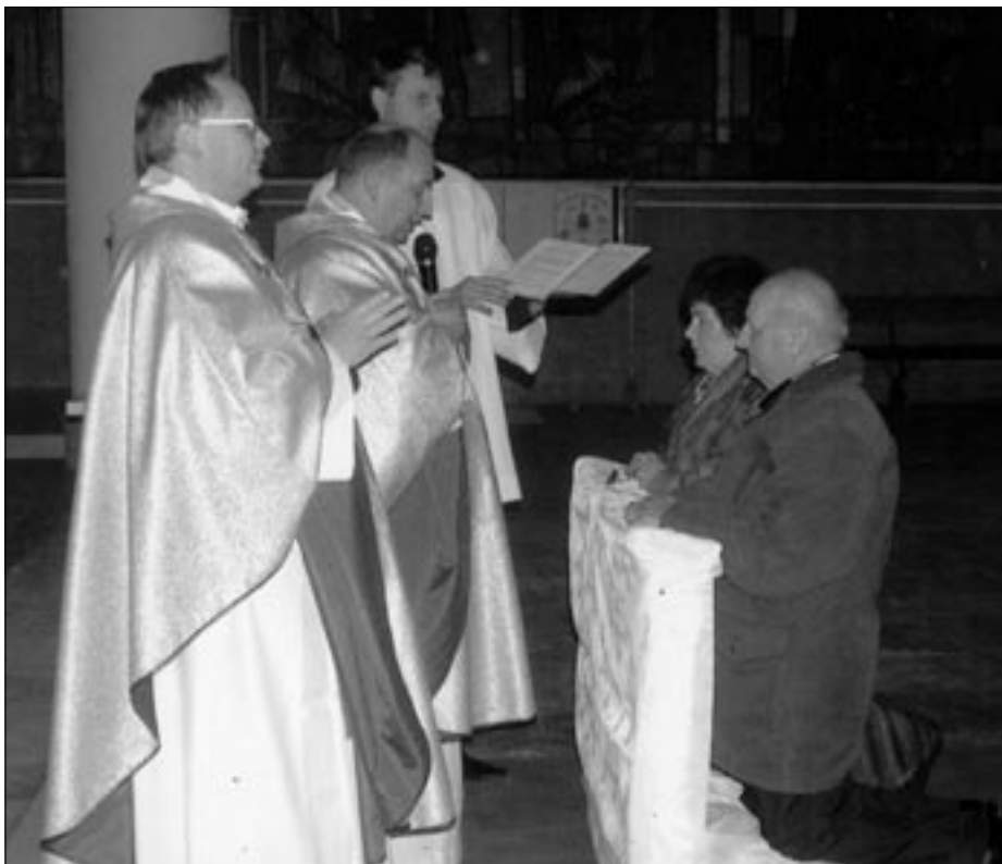
Uroczysta Msza św. juileuszowa

córka i zięć pracując w naszej piekarni mają inne, choć może jeszcze większe problemy – utrzymać to, co nam się udało stworzyć.