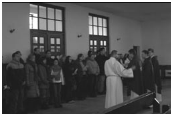
Przyjęcie do Deuterokatechumenatu