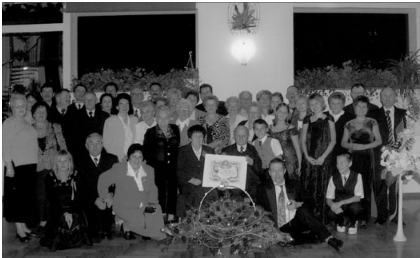
Jak zwykle takie chwile upamiętnione zostają na fotografii