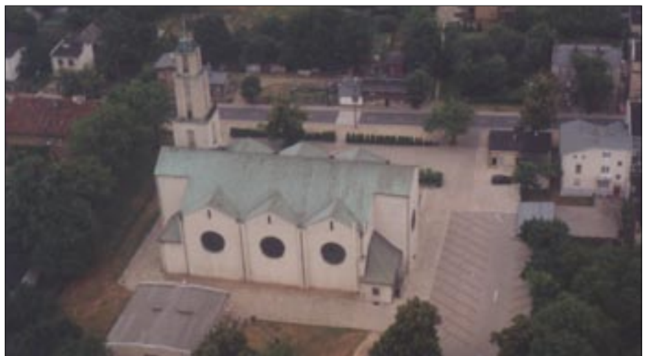
Starołęcki kościół parafialny z lotu ptaka