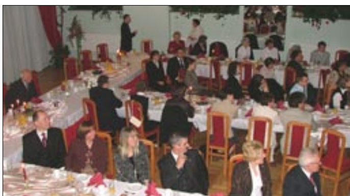
Uroczystą kolację uświetnił występ parafialnego zespołu muzycznego oraz