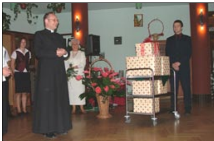
Prezent i kwiaty do grup działających w naszej parafii