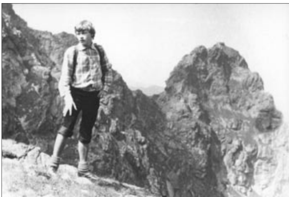
Bardzo lubiłem chodzić po górach.