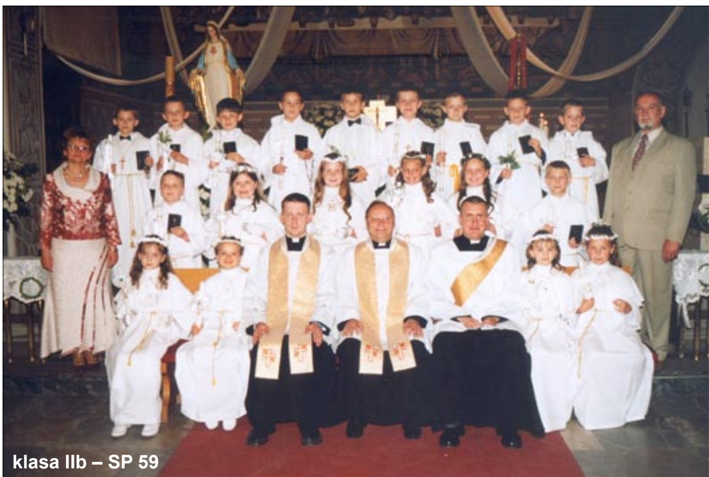
klasa IIb – SP 59