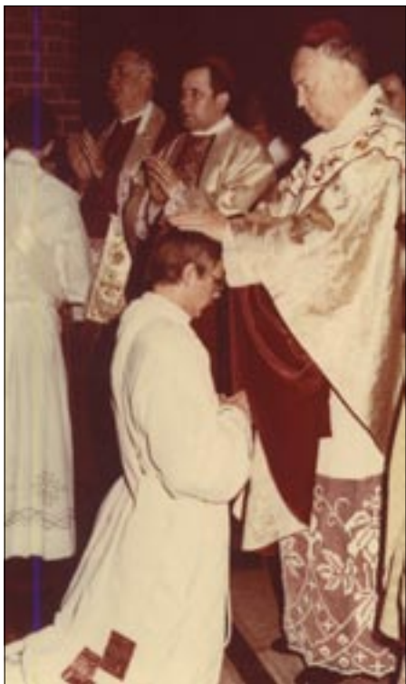
Święcenia kapłańskie przyjąłem z rąk arcybiskupa Jerzego Stroby

laninę (choć nigdy nie marzyłem o służbie wojskowej). W piłkę nożną grałem chętnie, zarówno w gronie podwórkowym, szkolnym jak i mini-stranckim.