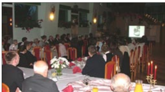
...pokaz slajdów z życia księdza proboszcza (który również był narratorem pokazu)

Niedziela, 21 maja 2006 r., kościół parafialny pw. św. Antoniego Padewskiego