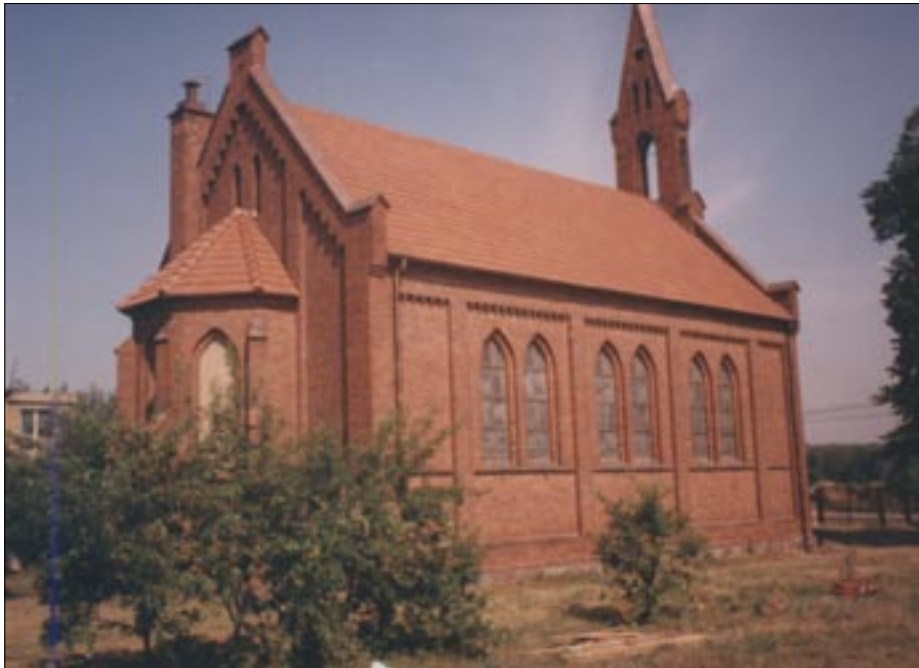
Pierwsza parafia – kościół pw. NMP Królowej Korony Polskiej w Zakrzewiu

nowym osiedlom domków jednorodzinnych w Dąbrówce i Pałędziu.