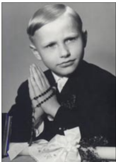
Pierwsza Komunia święta

Sympatyczne zabawy z podwórka to gry w chowanego i w strze-