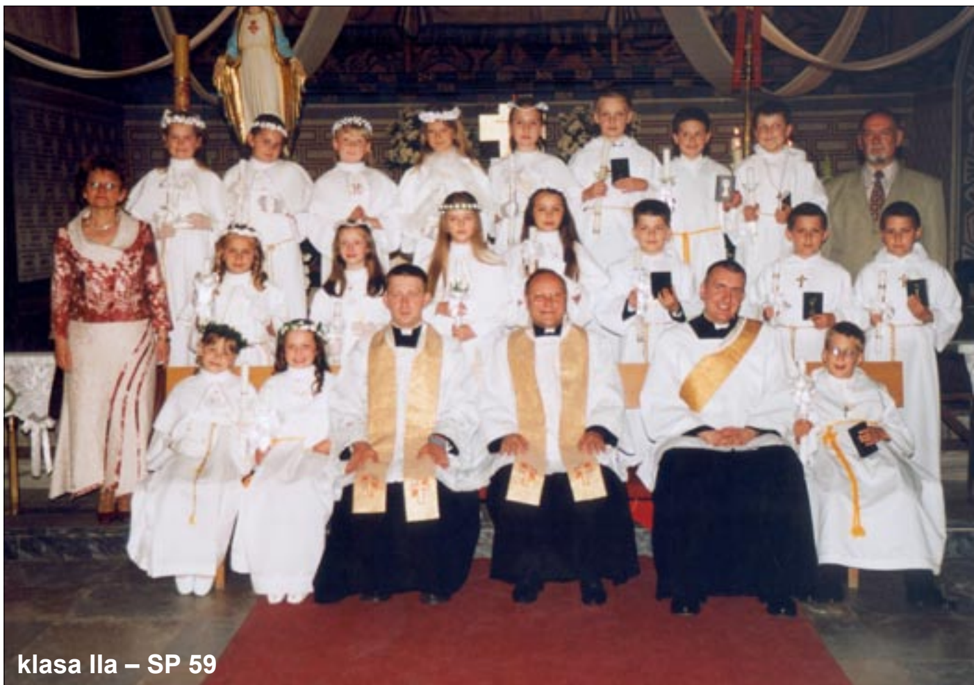
klasa IIa – SP 59