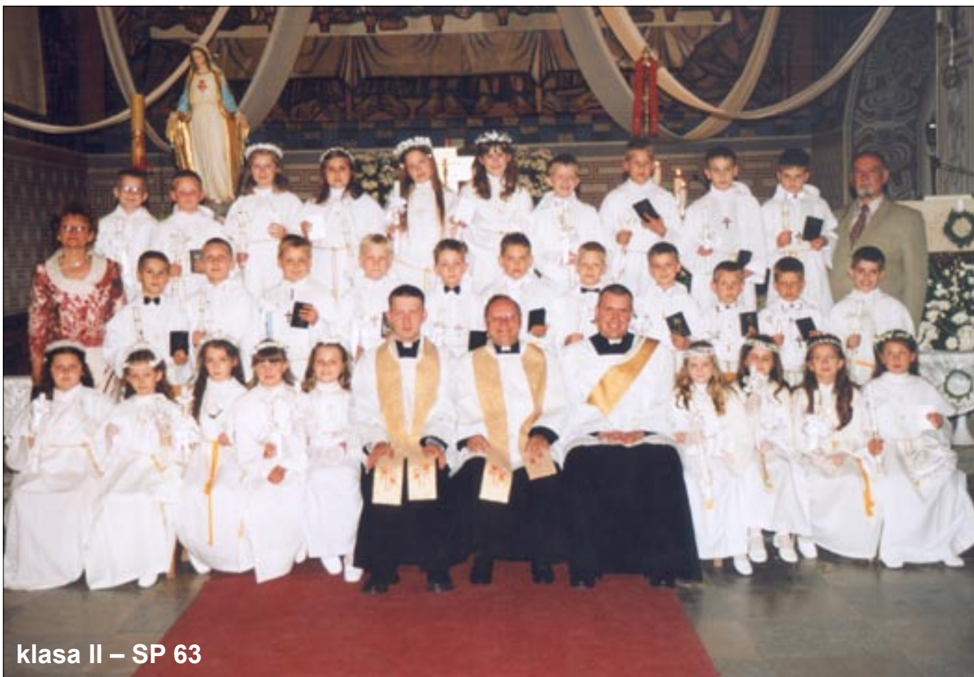
klasa II – SP 63