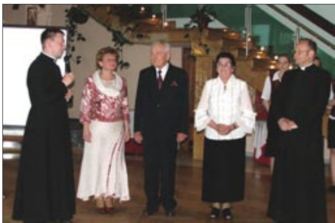
Życzenia składane w imieniu grup zrzeszonych przy naszej parafii

Sobota, 20 maja 2006 r., pensjonat "Wrzos", spotkanie z liderami grup działających w naszej parafii